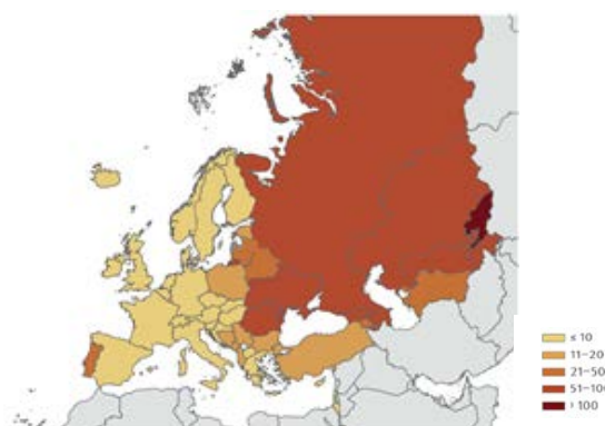
Рис.1 Расчетное значение показателя заболеваемости туберкулезом на 100 000 населения, Европейский регион ВОЗ, 2018